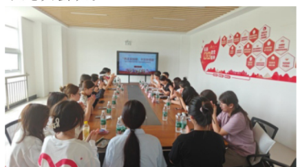
(教育学院 蔡念念/文)

本次座谈会旨在搭建师生沟通的桥梁，深入了解少数民族学生在校园中的学习与生活状况，帮助解决实际困难，并促进各民族学生之间的交流与融合。