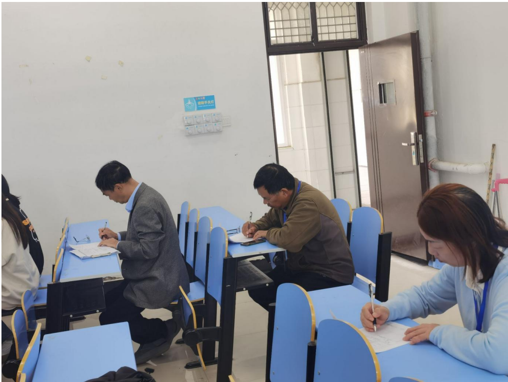
校领导、督导、分院领导深入课堂听课