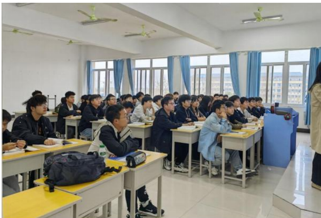
教师上课精神饱满、学生听课全神贯注

期中教学检查工作，是对学校教学质量监控的重要举措。通过全面、深入的检查和交流，学校进一步明确了教学工作中的优势与不足，为后续的教学改革和发展提供了方向。学校将以此次检查为契机，持续加强教学管理，不断优化教学过程，推动教学质量再上新台阶。