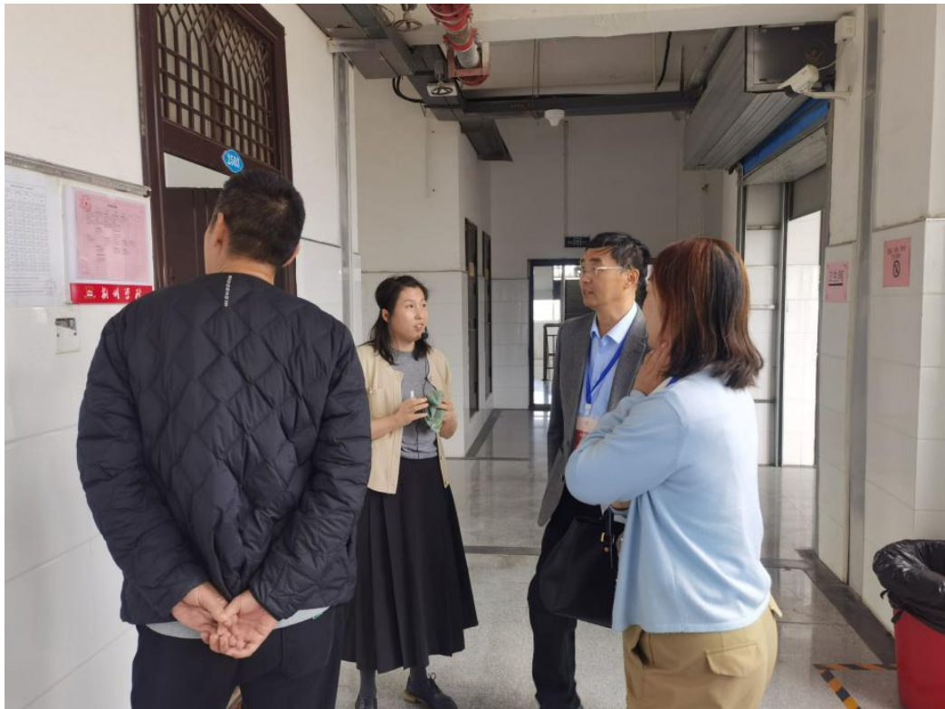
课后校领导与教师进行交流