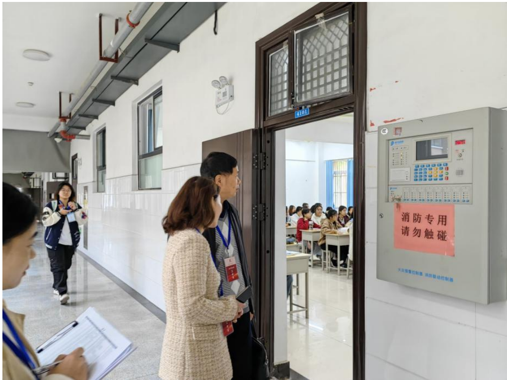
校领导、督导、分院领导巡查课堂